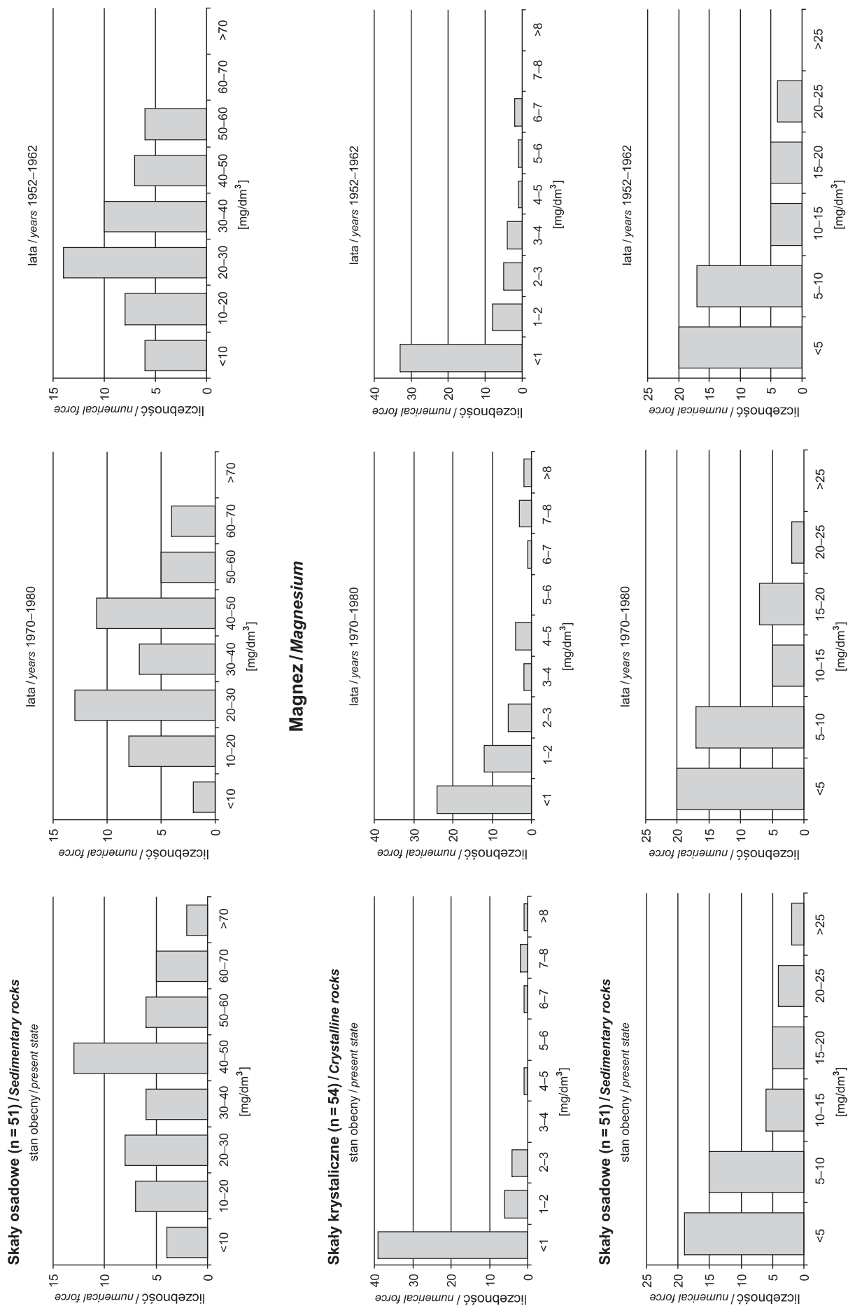
Fig. 2. Porównanie zawartości wybranych jonów w ostatnim sześćdziesięcioleciu

Comparison of the selected ions concentration over the last 60 year